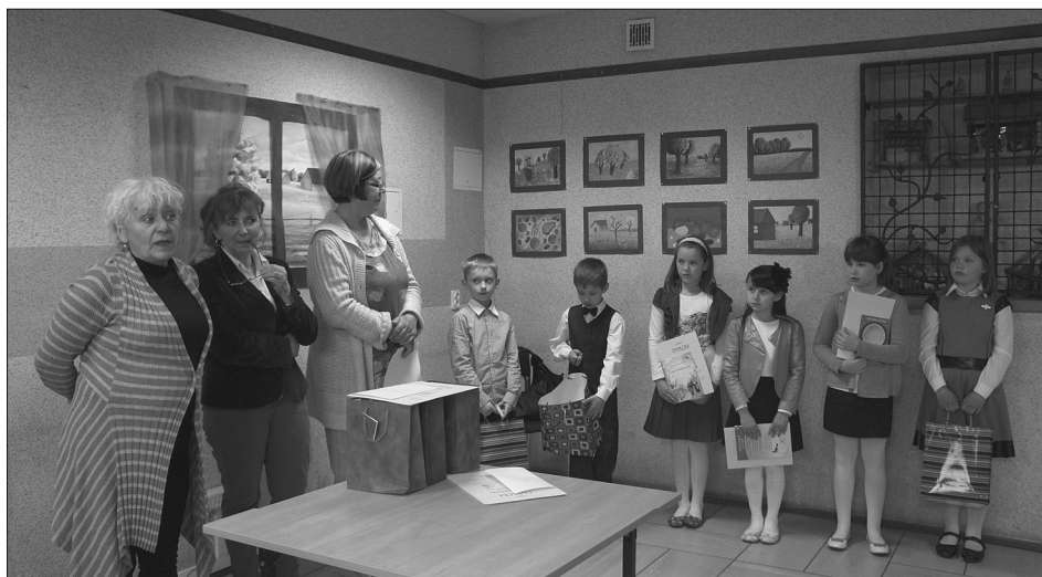
Laureaci konkursu recytatorskiego w grupie młodszej